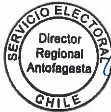
ABEL CASTILLO RENDIC DIRECTOR REGIONAL REGIÓN DE ANTOFAGASTA